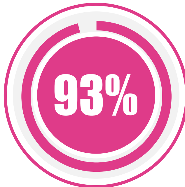
对访客质量感到满意